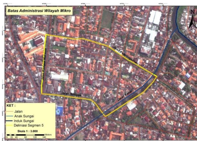
Gambar 1. Peta Batas Administrasi Wilayah Mikro (Analisis Penulis, 2017)

Kawasan perancangan wilayah mikro merupakan salah satu kawasan yang dilalui oleh anak sungai Banjir Kanal Timur yaitu Sungai Manggis. Pada kawasan perancangan terdapat beberapa masalah diantaranya yaitu terdapat Pedagang Kaki Lima yang berdagang di tepian sungai cenderung liar dan tidak tertata, sementara kawasan permukiman sendiri yang terdapat di tepian sungai bisa dikatakan kumuh.