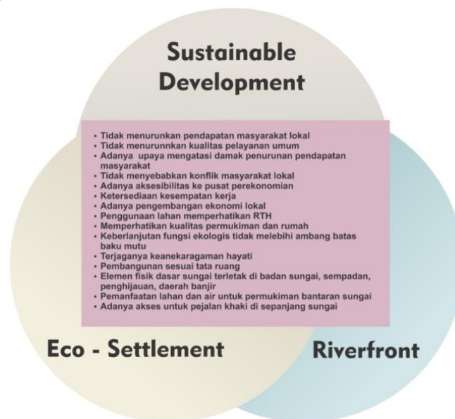
Gambar 3. Diagram Sintesa Literatur Mengenai Indikator Konsep Eco Green Living (Analisis Penulis, 2017)

Dari beberapa teori yang dapat dijadikan acuan dan mendukung sebagai penentuan konsep perancangan pada kawasan Kelurahan Peterongan dengan wilayah yang berbatasan langsung dengan Banjir Kanal Timur sehingga mengadopsi konsep “ Eco Green Living ”, Eco Green Living ini teori dasarnya merupakan dari teori-teori yang sudah dicantumkan dan diambil dari beberapa indikator yang dapat menyelesaikan permasalahan-permasalahan yang ada pada lokasi perancangan.