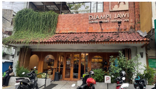
Gambar 3. Tampak Depan Djampi Jawi

Djampi Jawi Solo juga merupakan restoran yang menjual jamu didampingi dengan minuman rempah dan makanan khas nusantara yang memberikan kesan lebih modern dan berkelas. Djampi Jawi Solo terletak di Jl. Letjen S. Parman, Kestalan, Surakarta. Djampi jawi memiliki 2 cabang aktif saat ini yang terletak di Solo dan Yogyakarta. Jika melihat dari interior desain ruang mereka yang memang lebih tetap disebut sebagai restoran dibandingkan kafe karena konsep yang disajikan beserta pelayanan mereka yang sangat profesional dan itu juga tercermin dalam slogan merek yaitu "Djampi Jawi Restone Mbok Jamu". Walaupun demikian, Djampi Jawi juga menjadi salah satu bentuk yang membawa jamu ke ranah lebih modern. Menu jamu yang disajikan di Djampi Jawi antara lain Beras Kencur, Coastal Brezze (Campuran bunga telang dan jeruk nipis), Kunir Asem, Smeltd Candy (rosella), Gula Asem, Cabe Puyang dan Temulawak dan menu ini masuk dalam menu Signature Djampi Jawi.