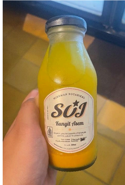
Gambar 2. Jamu House Blend Suwe Ora Jamu

Djampi Jawi Solo juga merupakan restoran yang menjual jamu didampingi dengan minuman rempah dan makanan khas nusantara yang memberikan kesan lebih modern dan berkelas. Djampi Jawi Solo terletak di Jl. Letjen S. Parman, Kestalan, Surakarta. Djampi jawi memiliki 2 cabang aktif saat ini yang terletak di Solo dan Yogyakarta. Jika melihat dari interior desain ruang mereka yang memang lebih tetap disebut sebagai restoran dibandingkan kafe karena konsep yang disajikan beserta pelayanan mereka yang sangat profesional dan itu juga tercermin dalam slogan merek yaitu "Djampi Jawi Restone Mbok Jamu". Walaupun demikian, Djampi Jawi juga menjadi salah satu bentuk yang membawa jamu ke ranah lebih modern. Menu jamu yang disajikan di Djampi Jawi antara lain Beras Kencur, Coastal Brezze (Campuran bunga telang dan jeruk nipis), Kunir Asem, Smeltd Candy (rosella), Gula Asem, Cabe Puyang dan Temulawak dan menu ini masuk dalam menu Signature Djampi Jawi.