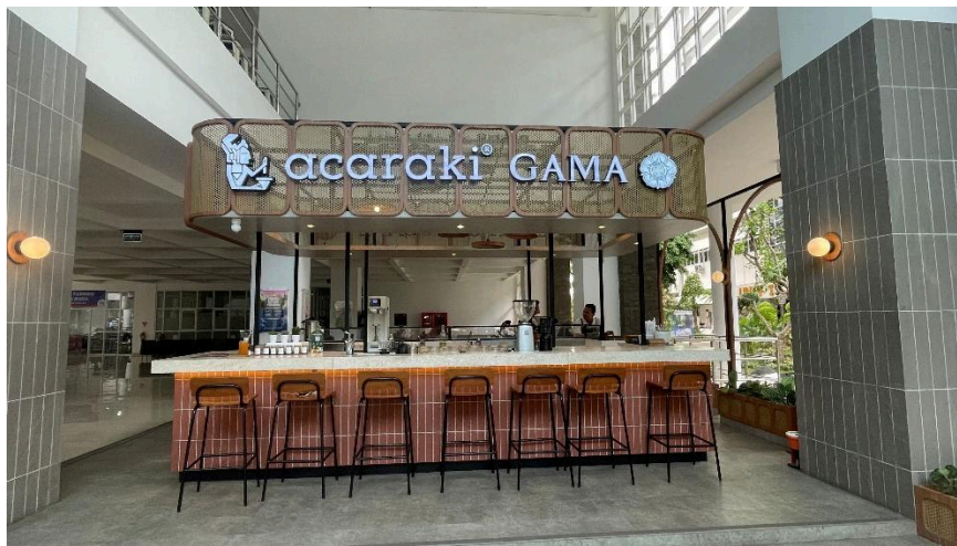
Gambar 4. Tampak Depan Acaraki Gama