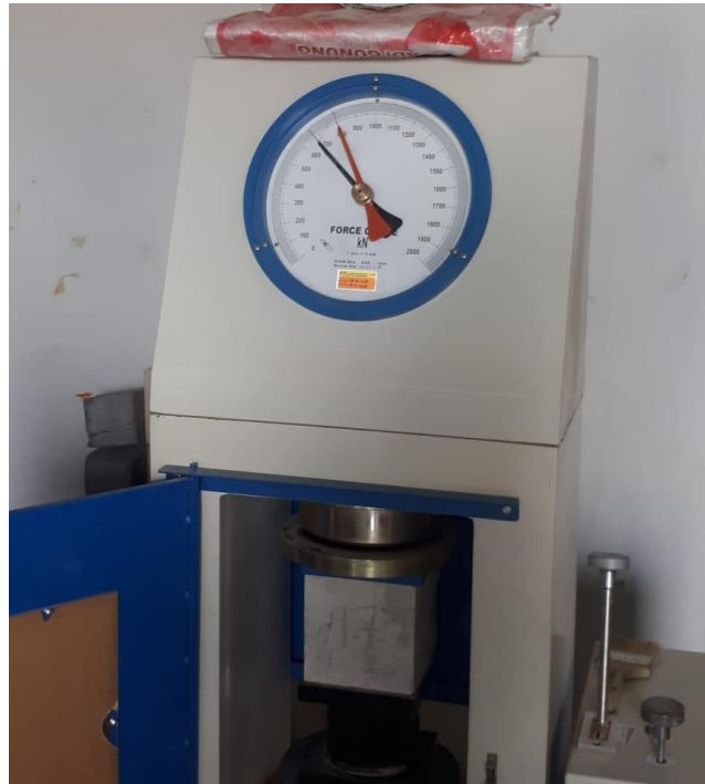
Gambar 2. Alat Uji Kuat Tekan