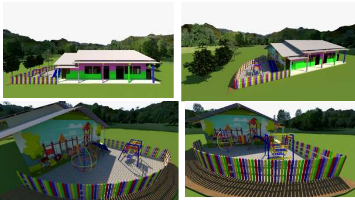
Gambar 4. View perspektif dari redesain TK Tarbiyatul Athfal 53