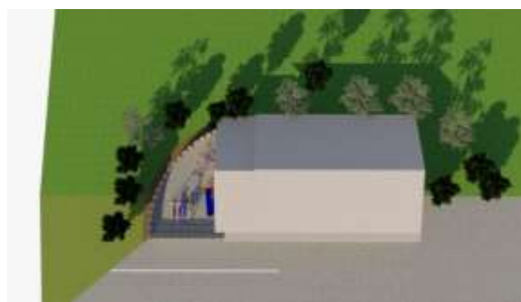
Gambar 3. Gambar Situasi

Keseluruhan proses ini diharapkan dapat menciptakan lingkungan belajar yang lebih aman, nyaman, dan mendukung perkembangan anak usia dini di TK Tarbiyatul Athfal 53.