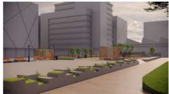
Gambar 7. View perspektif jogging area dan parkir mobil dari alun-alun Sentana Desa Katelan Kecamatan Tangen Kabupaten Sragen