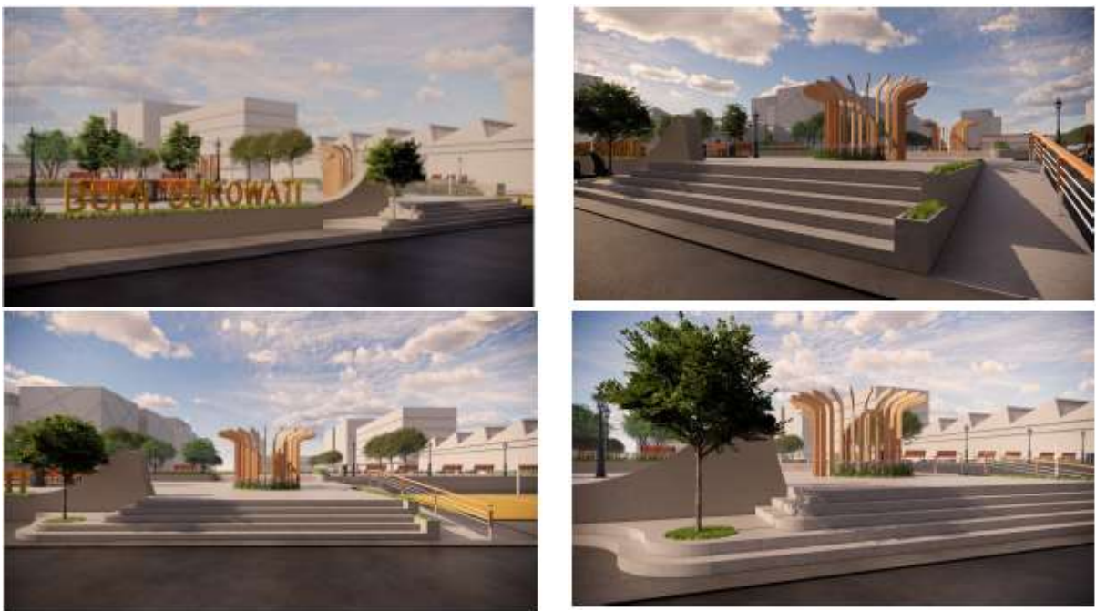
Gambar 5. View perspektif entrance dari alun-alun Sentana Desa Katelan Kecamatan Tangen Kabupaten Sragen