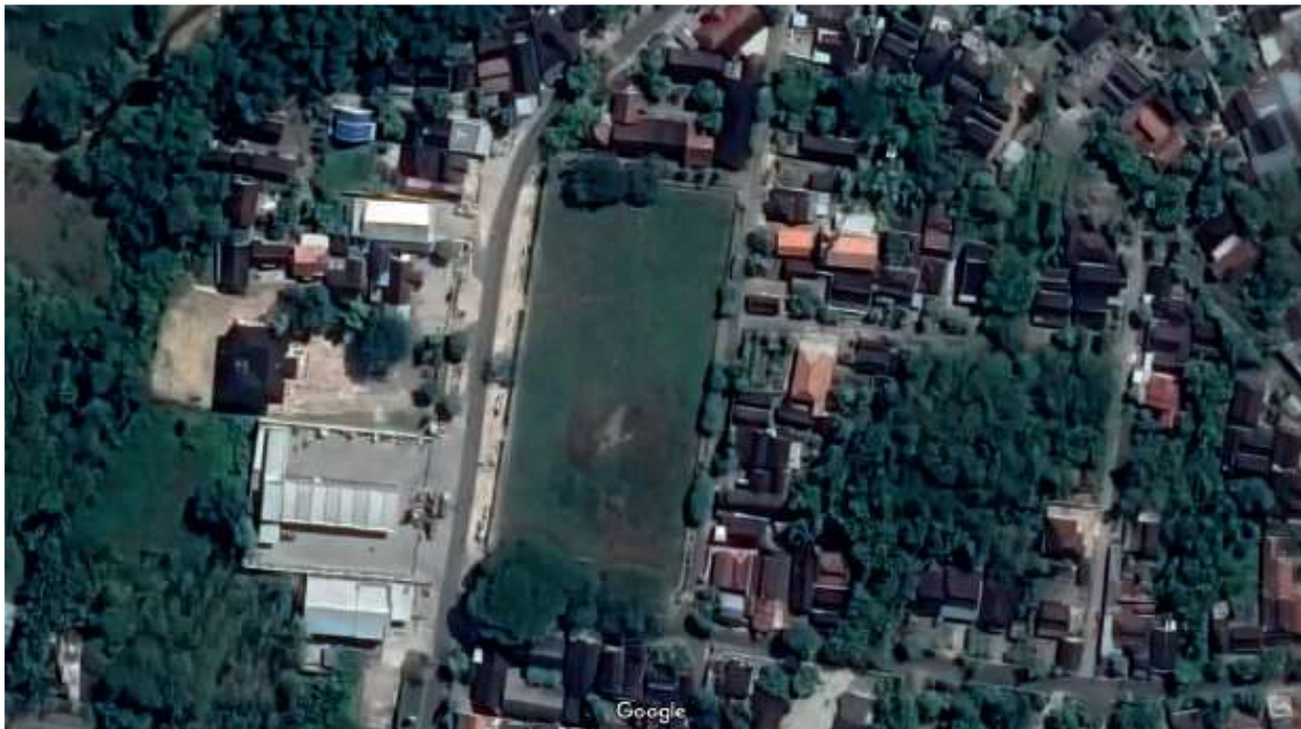
Gambar 1. Pencitraan satelit objek pengabdian

Sedangkan berdasarkan kegiatan survey yang telah dilakukan, kondisi eksisting dari kawasan alun alun terlihat pada Gambar 3 .