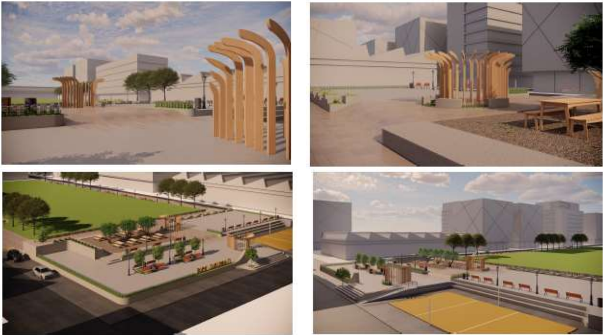
Gambar 4. View perspektif dari alun-alun Sentana Desa Katelan Kecamatan Tangen Kabupaten Sragen