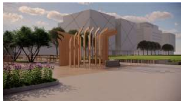
Gambar 8. View perspektif area BUMDes dari alun-alun Sentana Desa Katelan Kecamatan Tangen Kabupaten Sragen