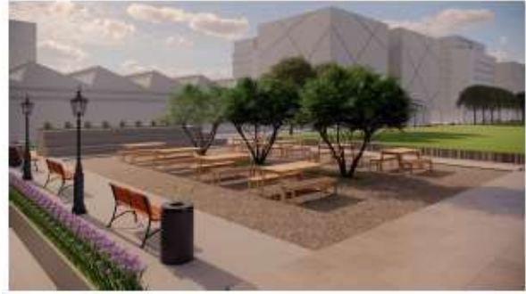
Gambar 6. View perspektif sitting area dari alun-alun Sentana Desa Katelan Kecamatan Tangen Kabupaten Sragen