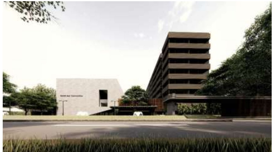
Bangunan gaya arsitektur kontemporer, memisahkan sifat kebutuhan ruang antara konvensi dan hotel.