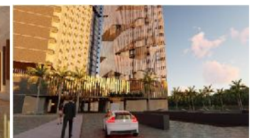
Bagian lobby dan entrance Apartemen Mahasiswa Undip.