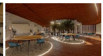
Bagian ruang-ruang komunal yang digunakan penghuni sebagai kegiatan belajar.