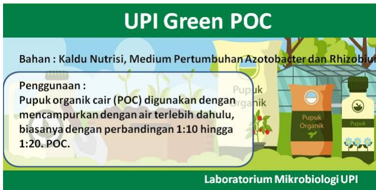
Gambar 5. Desain label POC

Botol kemasan ini dirancang menggunakan plastik dengan ukuran 500 ml yang ditampilkan pada gambar 4, kemasan botol spray dan kemasan botol biasa. Agar kemasan lebih menarik maka kami akan menambahkan label keterangan penggunaan, identitas produk, nama produk sehingga produk ini memiliki daya guna dan daya jual. Label kemasan ditunjukkan pada gambar 5, desain label POC dan gambar 6, desain tukar botol.