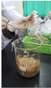
Gambar 2 Memilah bahan padat