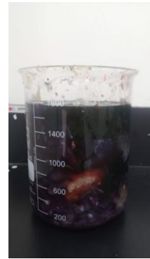
Gambar 3 Memilah bahan cair

Setelah proses destruksi menggunakan autoclave , tahapan selanjutnya adalah memilah limbah organik padat dan cair ke tempat yang berbeda. Limbah organik tersebut berasal dari bahan praktik mikrobiologi terapan, mikrobiologi dan genetika. Limbah organik dikelompokkan menjadi bahan padat dan bahan cair. Pengumpulan dan perhitungan bahan uji coba pembuatan POC dan ecoenzim disajikan dalam tabel 3.