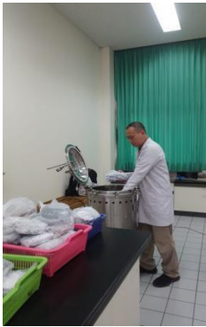
Gambar 1 Destruksi medium pertumbuhan bakteri