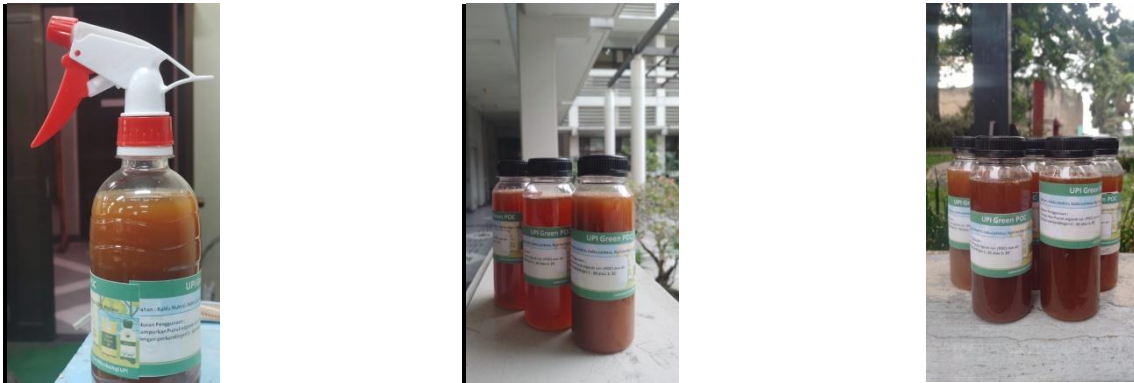
Gambar 4. Kemasan botol spray dan kemasan botol biasa

Botol kemasan ini dirancang menggunakan plastik dengan ukuran 500 ml yang ditampilkan pada gambar 4, kemasan botol spray dan kemasan botol biasa. Agar kemasan lebih menarik maka kami akan menambahkan label keterangan penggunaan, identitas produk, nama produk sehingga produk ini memiliki daya guna dan daya jual. Label kemasan ditunjukkan pada gambar 5, desain label POC dan gambar 6, desain tukar botol.