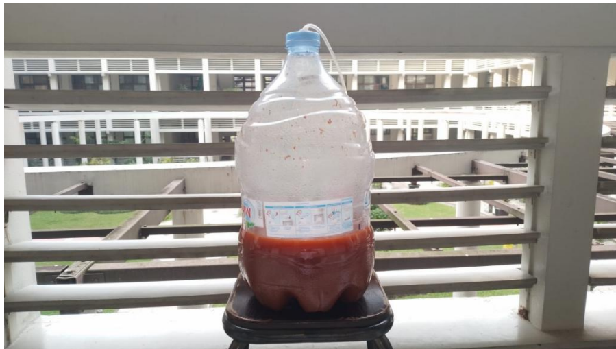
Gambar 8. Ecoenzim (produk yang dihasilkan setelah 90 hari)

Hasil akhir dari penelitian ini berhasil memproduksi 36,17 liter POC umum, 1,2 liter POC Rhizobium , 2,3 liter POC Azotobacter , 12 liter ecoenzim, serta produk sampingan berupa 1 kg pakan maggot fungsional. Seluruh produk dikemas secara sistematis, dilengkapi dengan label instruksi aplikasi, dipamerkan pada kegiatan Open Laboratory Fakultas, serta didistribusikan kepada masyarakat melalui skema sirkular "program penukaran botol bekas menjadi pupuk".