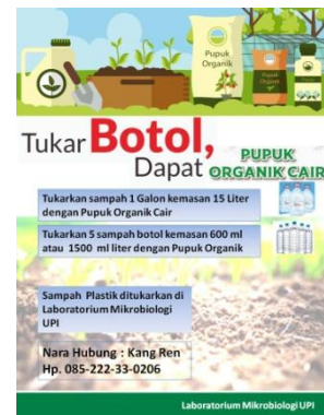
Gambar 6. Desain Tukar Botol

Untuk pengemasan Ecoenzim dapat menggunakan beberapa botol kemasan antara lain botol spray dengan volume 500 ml atau botol kemasan seperti yang digunakan untuk kemasan pupuk organik cair.