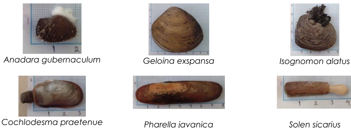
Gambar 1. Beberapa jenis-jenis Bivalvia yang ditemukan

Perbedaan nilai kepadatan bivalvia pada setiap stasiun juga disebabkan adanya faktor lain seperti penangkapan bivalvia yang tidak selektif oleh masyarakat sekitar. Hal ini terlihat pada saat penelitian berlangsung dimana masyarakat banyak menangkap dan memanfaatkan bivalvia baik untuk konsumsi sendiri maupun untuk dijual. Spesies bivalvia yang paling banyak ditangkap adalah Geloina expansa dan Meretrix meretrix . Hal ini juga terlihat pada sedikitnya bivalvia yang didapat dengan ukuran besar, yakni hanya beberapa spesies Geloina expansa dengan ukuran panjang cangkang 6,31 cm, spesies Lithophaga teres dengan panjang cangkang 6,8 cm dan Pharella javanica dengan panjang cangkang 7,45 cm. Berdasarkan hasil penelitian terlihat bahwa bivalvia berukuran sedang (3–5,25 cm) merupakan ukuran yang paling dominan sehingga dapat dikatakan bahwa bivalvia yang banyak ditemukan adalah bivalvia muda. Hal ini sejalan dengan Wanimbo dan John (2018) bahwa ukuran bivalvia 5,7 cm sampai 7,8 cm dikategorikan bivalvia dewasa. Bivalvia mampu tumbuh mencapai ukuran 4,89 cm – 16,5 cm (Gosling 2004). Hasil pengukuran morfometri cangkang bivalvia dapat dilihat pada Tabel 2.