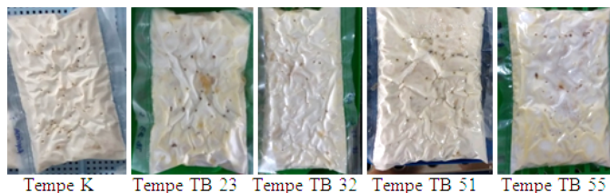
Gambar 1. Hasil dari tempe yang berhasil diproduksi. Tempe K (menggunakan laru komersial), Tempe TB 23 ( R. microsporus TB 23 dari "laru tradisional"), Tempe TB 32 ( R. microsporus TB 32 dari "laru tradisional"), Tempe TB 51 ( R. microsporus TB 51 dari "laru tradisional"), Tempe TB 55 ( R. microsporus TB 55 dari "laru tradisional").

Analisis ragam menunjukkan bahwa persepsi panelis terhadap rasa tempe K, tempe TB 23, tempe TB 32, dan tempe TB 51 tidak berbeda nyata. Namun rasa empat jenis tempe tersebut berbeda nyata dengan rasa tempe TB 55, dan tempe TB 55 ini merupakan tempe yang paling disukai oleh panelis atau yang paling enak (Tabel 2). Rasa tempe dapat timbul akibat terbentuknya peptida atau asam amino karena R. microsporus menghasilkan enzim selama proses fermentasi berlangsung (Witono et al. , 2015). Ukuran peptida dan jenis asam amino menjadi penentu rasa pahit, gurih ataupun asam pada tempe (Barus et al. , 2008).