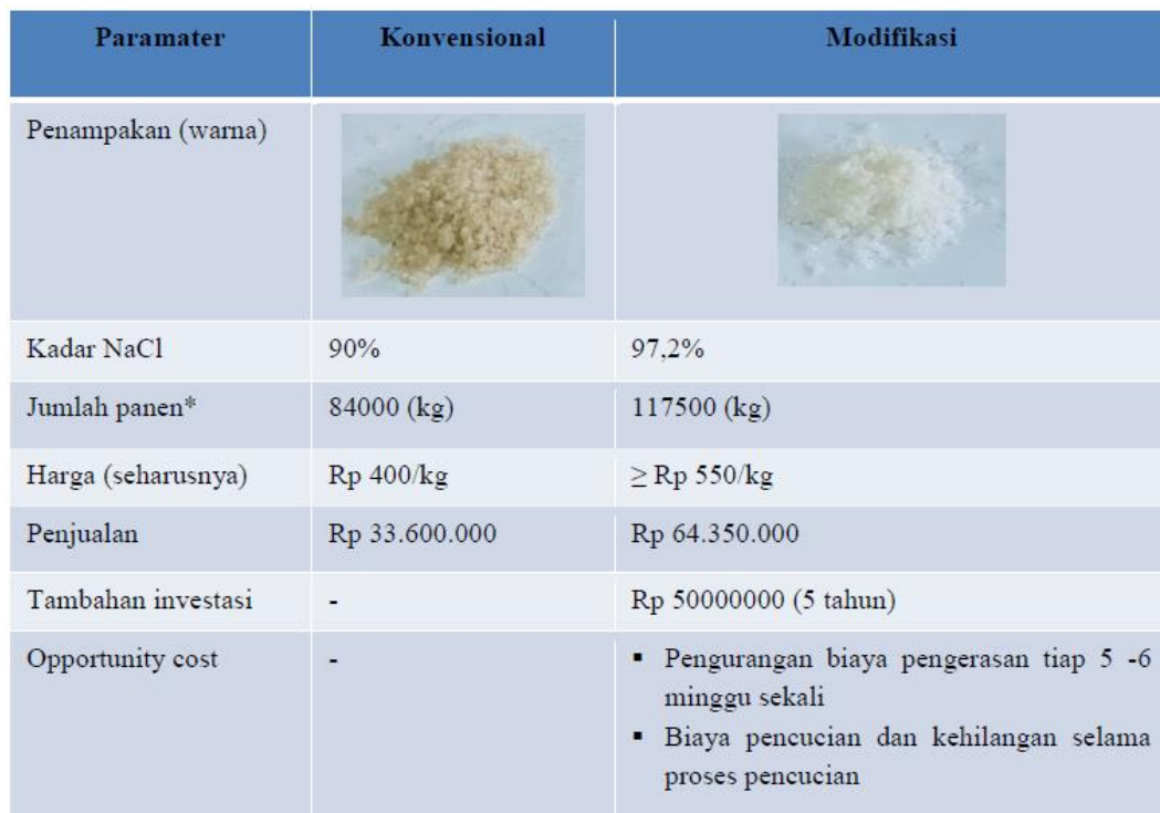
Tabel.1.Dampak introduksi teknologi dari pelaksanaan program IBM

penjualan garam hasil belum dilakukan sebagai akibat rendahnya harga garam pada saat musim panen ini. Penjualan garam akan dilakukan jika harga mencapai minimal Rp. 500/kg. Tabel 1 menyajikan dampak yang diperoleh terhadap introduksi teknologi yang dilakukan.