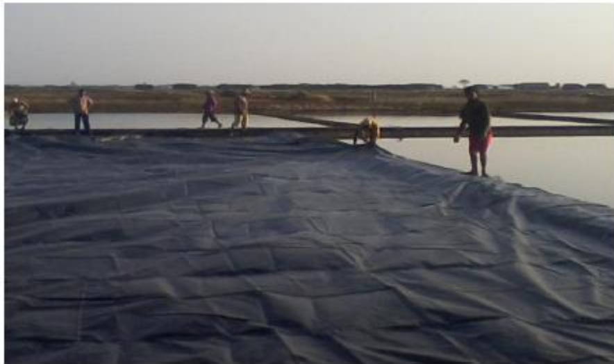
Gambar 3. Dokumentasi pemasangan terpal hitam (plastik HDPE) untuk menghalangi penetrasi air garam kebawah dan kesamping.

berakibat pada penggunaan panas yang tidak optimal dan pada akhirnya hasil produksi garam tidak maksimal. Secara umum, pengembangan proses produksi dilakukan untuk meningkatkan kuantitas dan kualitas produk garam yang dihasilkan. Perbaikan yang dilakukan pada proses ini adalah untuk meningkatkan efisiensi pemanasan dan peningkatan kualitas produk , dimana bagian dasar kolam penguapan akan dilapisi terpal warna hitam (Gambar 3).