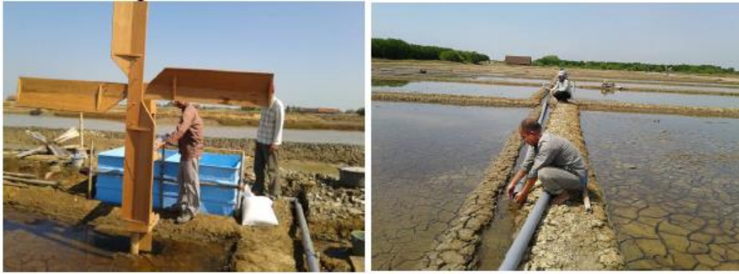
Gambar 2.: kegiatan pemasangan unit filtrasi dan pemipaan