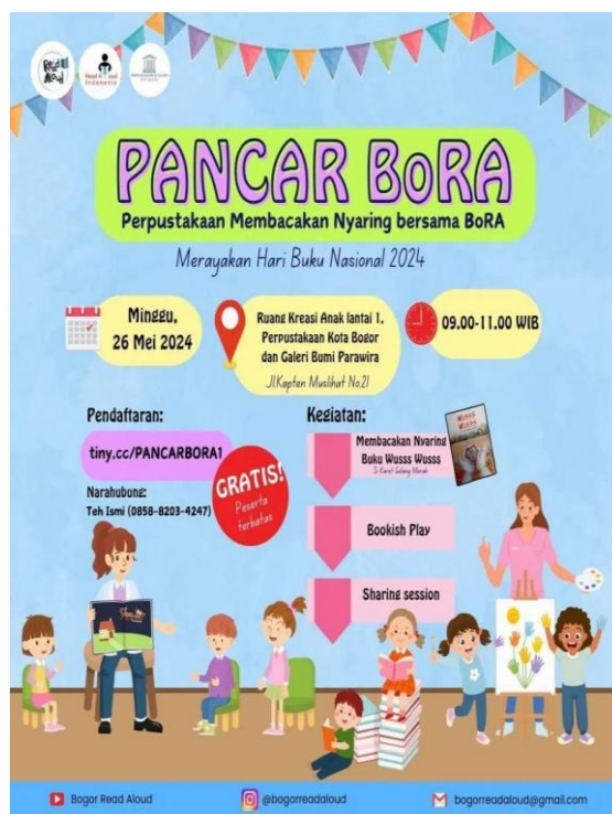
Gambar 2. Kegiatan Komunitas Bogor Read a loud di Minggu ke-4 Setiap Bulan

Perpustakaan dan Galeri Kota Bogor mengadakan acara di hari Sabtu dan Minggu. Tidak hanya itu, pada hari Sabtu dan Minggu terselenggara lokakarya atau seminar tentang topik tertentu seperti penulisan kreatif, penelitian, keterampilan digital, atau keterampilan hidup lainnya. Hal ini terjadi karena komunitas diberikan ruang untuk dapat melaksanakan kegiatan di perpustakaan pada hari Sabtu dan Minggu. Acara lainnya adalah terbentuknya Klub Buku. Acara ini merupakan pertemuan klub buku di mana anggota dapat berdiskusi tentang buku yang mereka baca. Kegiatan lainnya adalah kegiatan membaca bersama, mendongeng, atau kerajinan tangan yang melibatkan orang tua dan anak-anak. Berikut adalah contoh poster kegiatan Pancar Bora: Perpustakaan membacakan nyaring bersama Bora, yang berlangsung di Perpustakaan dan Galeri Kota Bogor pada hari Minggu (lihat Gambar 2).