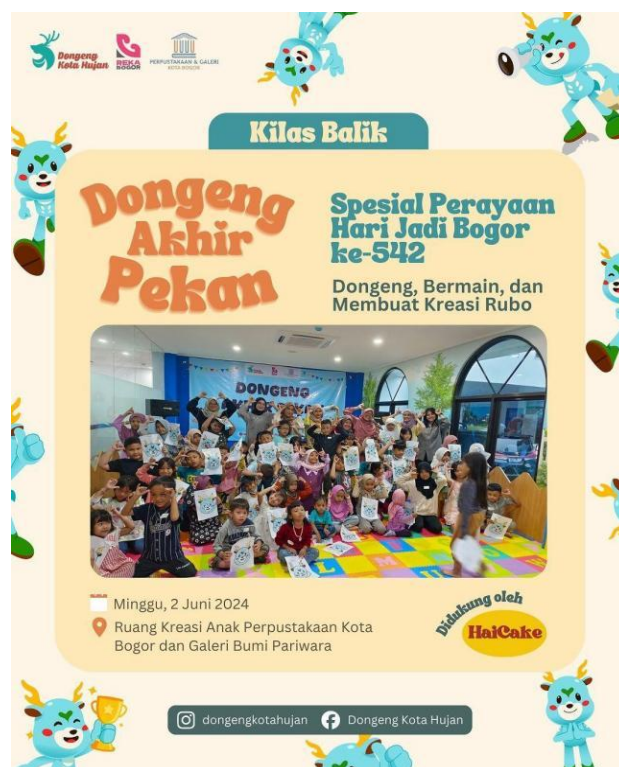
Gambar 3. Kegiatan Komunitas Dongeng Kota Hujan di Minggu ke-1 Setiap Bulan

Selain itu, perpustakaan juga menjalin kemitraan dengan komunitas lokal untuk menyelenggarakan berbagai kegiatan yang bermanfaat bagi masyarakat. Keterlibatan komunitas menjadi penting karena mampu menghadirkan aktivitas literasi yang lebih kreatif dan partisipatif. Salah satu contoh nyata dari kolaborasi ini adalah kegiatan Komunitas Dongeng Kota Hujan yang secara rutin menyelenggarakan kegiatan mendongeng pada minggu pertama setiap bulan di perpustakaan (lihat Gambar 3). Kegiatan tersebut tidak hanya menarik minat anak-anak dan keluarga untuk berkunjung ke perpustakaan, tetapi juga memperkuat fungsi perpustakaan sebagai ruang publik yang mendukung pengembangan budaya literasi di masyarakat. Dengan demikian, berbagai bentuk kemitraan yang terjalin menunjukkan bahwa kolaborasi yang dibangun dalam Program Literasi Squad mampu memperluas jaringan kerja sama serta meningkatkan partisipasi komunitas dalam kegiatan literasi di perpustakaan. Hal ini juga menambahkan hasil penelitian Sabolović-Krajina (2020) yang menunjukkan perpustakaan memainkan peran penting dalam literasi kesehatan dengan berkolaborasi dengan organisasi kesehatan lokal untuk mendidik dan melibatkan masyarakat.