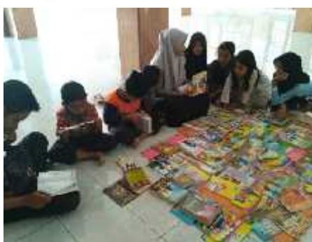
Gambar 4. Kegiatan Pembinaan Minat Baca Masyarakat.

Dalam pelaksanaan pembangunan taman bacaan masyarakat, yang menjadi target dari tolak ukur itu sendiri adalah dengan adanya kegiatan pembinaan minat bacaan masyarakat yang dilakukan di taman bacaan Dusun Kemas ini. Kegiatan pembinaan minat baca dilakukan secara terus menerus dengan cara peneliti dan komunitas literasi hadir di taman bacaan untuk mengetahui kondisi bagaimana minat baca anak-anak ketika ada dan atau tanpa adanya peneliti juga komunitas literasi. Oleh karena itu, peneliti selalu mencoba koordinasi dengan masyarakat khususnya informan terkait dengan kondisi anak-anak terutama dalam hal membaca buku dengan ada atau tanpa adanya peneliti dan komunitas literasi apakah pembinaan minat baca yang dilakukan setiap minggu dengan cara memberi motivasi, semangat untuk membaca hingga keuntungan jika rajin membaca memberikan efek yang baik untuk anak-anak atau tidak. Dengan adanya pemantauan langsung yang dilakukan informan.