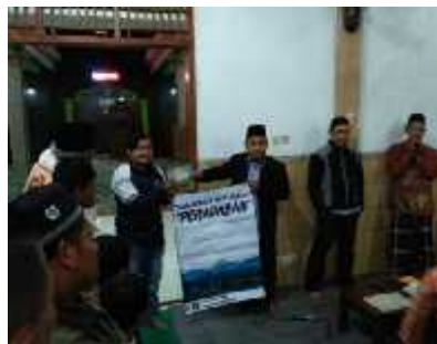
Gambar 3. Penyerahan Donasi Buku dan Peresmian Simbolis Pembangunan Taman Bacaan Masyarakat.

Setelah berbagai proses dilakukan dalam penggalangan dana dan pengadaan buku untuk pembangunan taman bacaan masyarakat, maka secara simbolis peneliti meresmikan pembangunan taman bacaan masyarakat kepada kepala dusun dan anak-anak pada saat kegiatan pengajian yang rutin dijalankan oleh anak-anak dan sekaligus sebagai agenda pamit kepada masyarakat Dusun Kemas yang telah bersedia menerima kegiatan kuliah kerja nyata yang dilakukan oleh mahasiswa Undip. Hal tersebut diabadikan dan diberitakan kepada masyarakat dusun baik melalui lisan ataupun media sosial oleh kepala dusun. Semua agenda berjalan dengan lancar dan taman bacaan masyarakat Dusun Kemas mulai hari itu bisa dilaksanakan dengan dan atau tanpa peneliti.