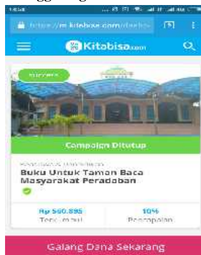
Gambar 2. Kampanye Penggalangan Dana melalui Situs Online Kitabisa.com.

Setelah melakukan proses penggalangan dana dan pengadaan buku, maka peneliti melakukan proses diskusi lebih lanjut dengan kepala dusun dan perangkat dusun setempat untuk melaporkan progres penggalangan dana dan pengadaan buku. Peneliti terus melakukan koordinasi dan komunikasi secara intens sehingga kepala dusun pun selalu mencoba membantu mempublikasikan setiap kegiatan penggalangan dana dan pengadaan buku yang dilakukan oleh peneliti di akun media sosialnya. Ketika proses penggalangan dana dan pengadaan buku berjalan, peneliti juga mencoba membuat konsep terkait dengan pembangunannya nanti.