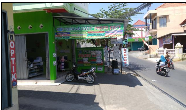
Gambar 1. Aktivitas Komersial Pada Koridor Jalan Taman Siswa

Siswa. Semakin berkembangnya kawasan koridor Jalan Taman Siswa ini merupakan pengaruh dari keberadaan Unnes sebagai pusat pertumbuhan baru di Kecamatan Gunungpati khususnya Kelurahan Sekaran. Perkembangan Koridor Jalan Taman Siswa yang pesat ini bisa saja disebabkan oleh permintaan yang banyak karena keberadaan Unnes akan fungsi komersial tertentu. Selain itu perkembangan koridor jalan ini bisa saja sebagai pendukung dari aktivitas utama kawasan yaitu aktivitas pendidikan yang didominasi oleh keberadaan Unnes seperti pada gambar 1 berikut.